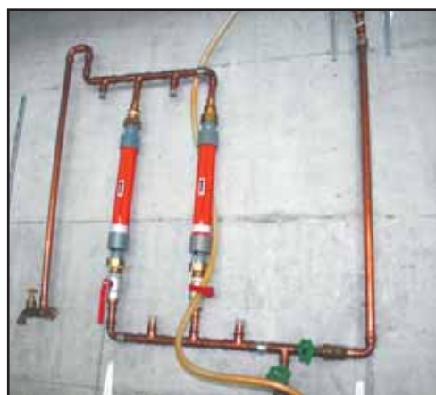
Ces deux tubes d'un appareil Aqua 4D éliminent les dépôts corrosifs à l'intérieur des tuyaux d'eau. LE NOUVELLISTE

Au bout d'une trentaine d'années, un tuyau fortement corrodé se fissure et laisse couler son liquide. Celui-ci infiltre les murs, qui se mettent à pourrir. Le plus simple, c'est de résoudre le problème à la base, comme à Venthône. Planet Horizons a installé un système de purification dans son réservoir d'eau potable, qui alimente mille habitants. Ici, on a visé l'élimination du calcaire.